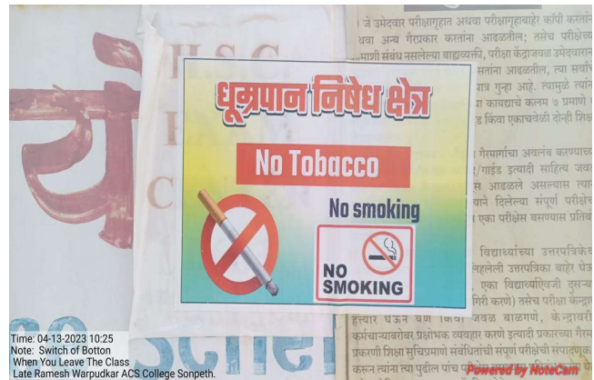
No Smoking Campaign