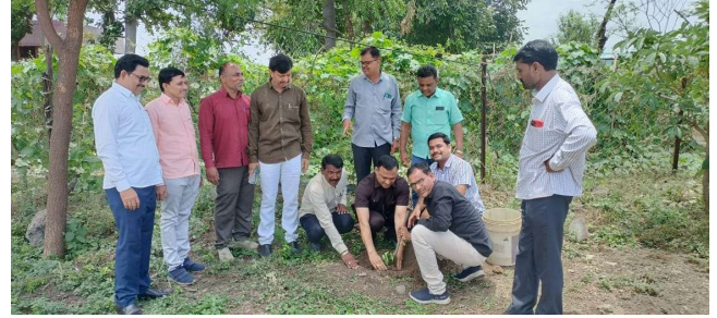
Tree Plantation in 2023-24