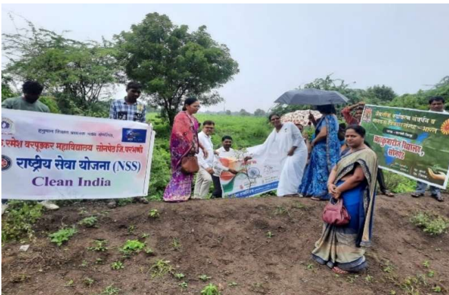
Tree Plantation in 2022-23