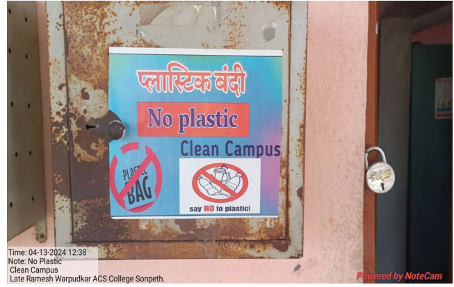
Plastic Ban Campaign