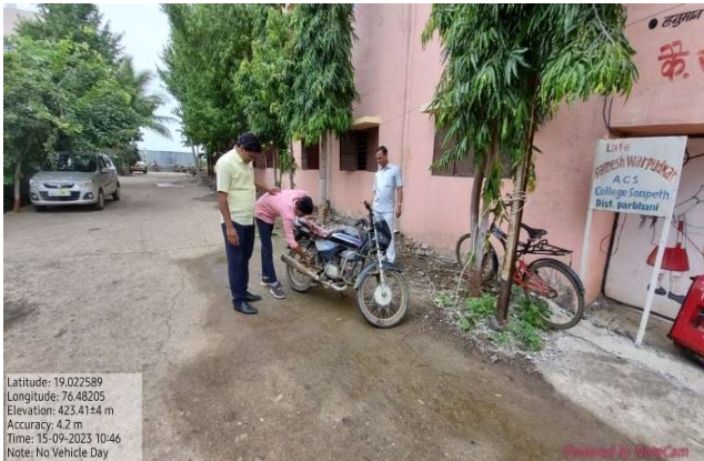
Restriction for Use of vehicle on -No Vehicle Day