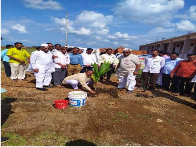
Tree Plantation in 2019-20