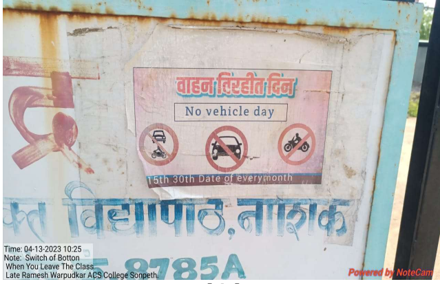
No Vehicle Day