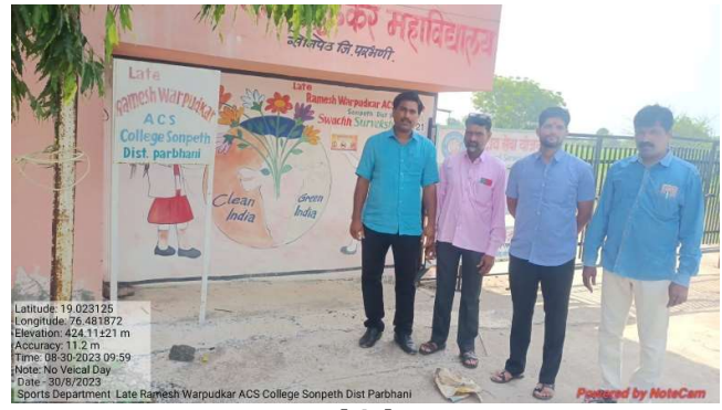
No Vehicle Day