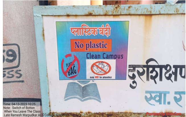
Plastic Ban Campaign