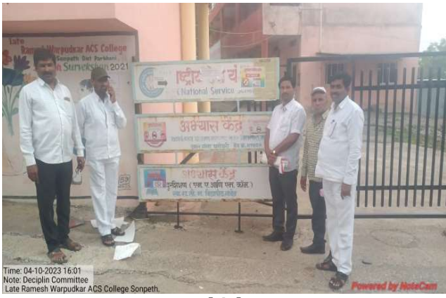
No Vehicle Day